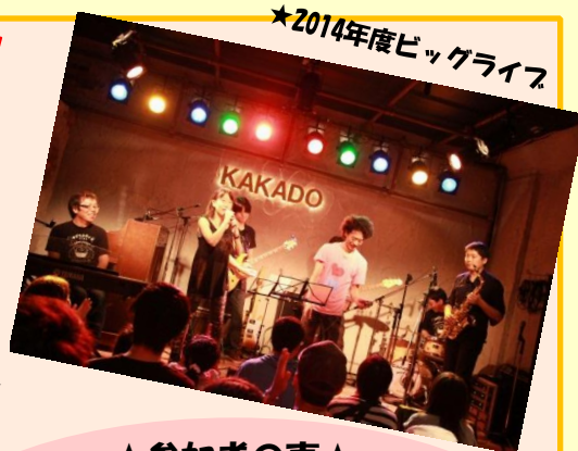
★2014年度ビッグライブ